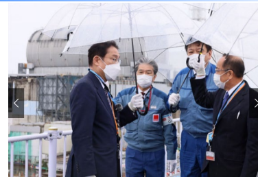
Визит премьер-министра Фумио Кисида Осмотр в обычной одежде (октябрь 2021 г.)