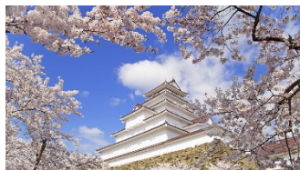
Замок Цуруга весной