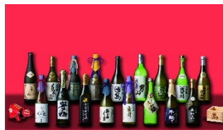
Саке из Фукусимы