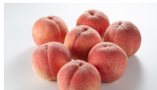
Персики из Фукусимы